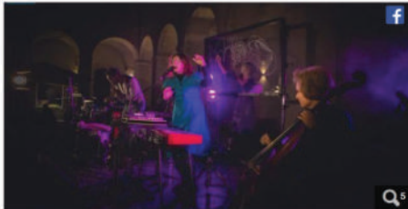
Daisies Fields en concert à La Vallée.

Le Mans. Bientôt un premier album pour Daisies Fields