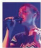
Daisies Fields, artiste

Comment vivez-vous ce premier passage au festival Bebop ?