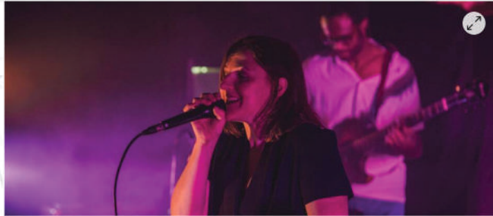
Daisies Fields | CLAUDE JABOT

Le Mans. Le Poulpe à vapeur invite des artistes