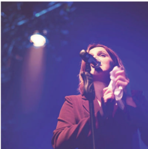
Un beau moment en perspective au centre du Val de Vray organise, le vendredi 23 mars.

Le centre du Val de Vray organise, le vendredi 23 mars, à 20 h 45, un concert dont l'affiche sera le groupe Daisies Fields et son style pop nomade. Avec à sa tête une auteure-compositeur-interprète mancelle, Daisies Fields est un projet pop associant des instruments acoustiques, des sonorités électroniques et des textes qui... sonnent. Les spectateurs seront plongés dans un univers poétique et onirique avec des arrangements musicaux diversifiés.